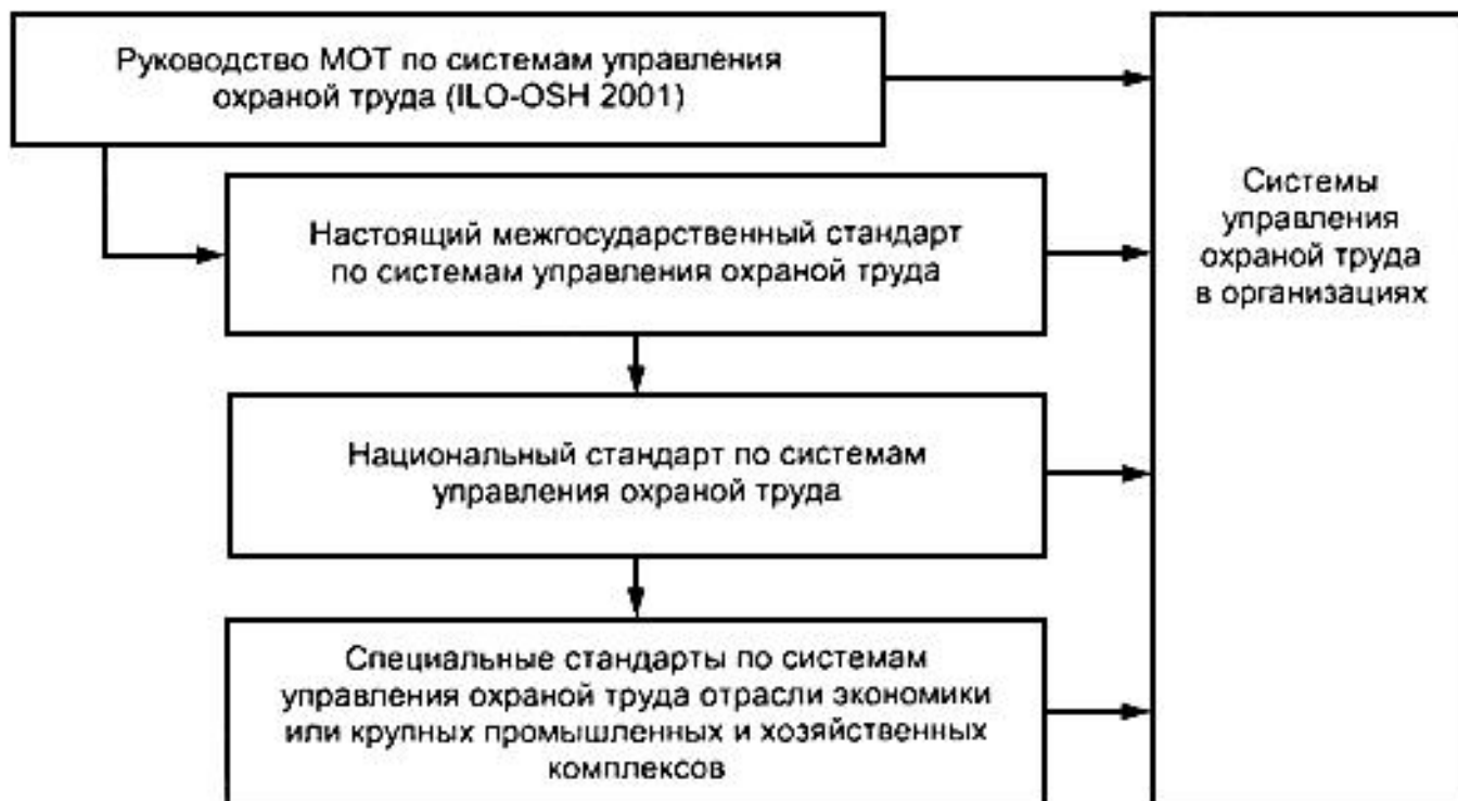
Рисунок 1 - Элементы национальных структур систем управления охраной труда