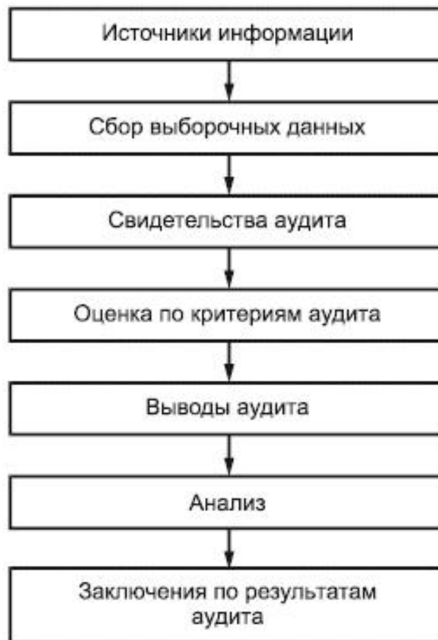
Рисунок 3 - Блок-схема процесса, начиная от сбора информации до получения заключений по результатам аудита